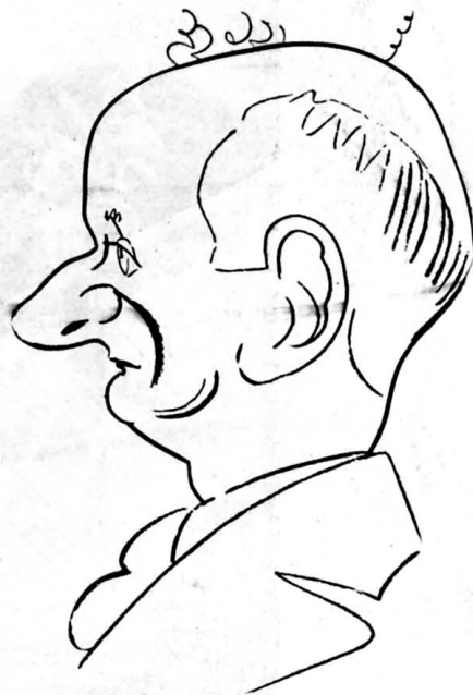
Den avgåtte formann.