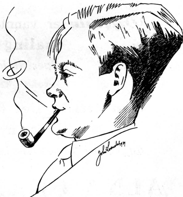
Den nye formann.

De 3 nye menn i styret som var foreslått og ble valgt, presenterer vi denne gang under fullt navn;